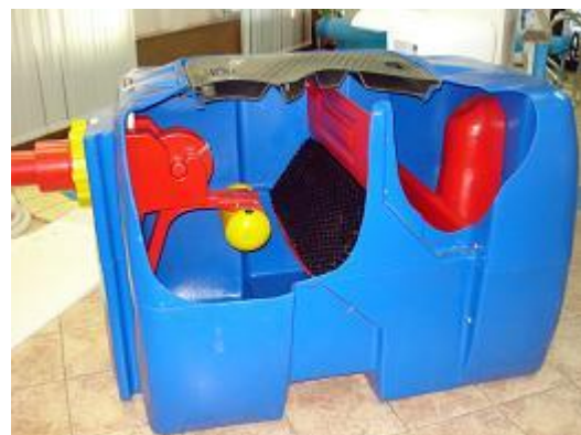
Рис 2. Нефтеулавливатель

Необходимо правильно подбирать производительность нефтеуловителя в зависимости от объема загрязнённых стоков. Нефтеловушки предназначены для очистки сточных вод, при номинальном потоке от 1,5 до 600 л/сек.