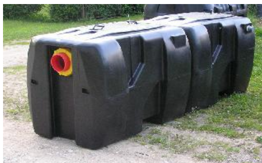
Рис 2. Нефтеулавливатель